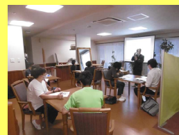
職員研修の様子 ソーシャルディスタンス 換気・人数制限等に 配慮して実施しています