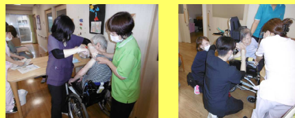
ワクチン接種の様子

入居者様・職員のコロナワクチン接種を行いました。 感染症対策として日々の予防策を継続しています。 職員の研修会も感染症対策に配慮して行っています。