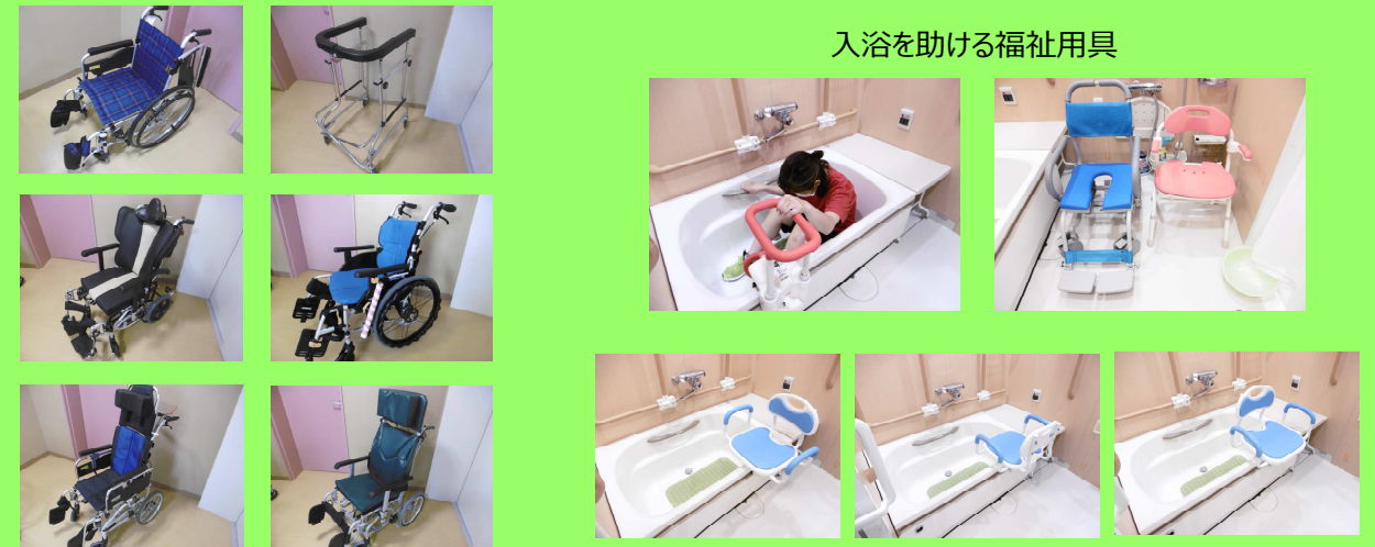
入浴を助ける福祉用具

自立支援の促進と、安楽に過ごしていただけるよう、その方に合わせた福祉用具や車椅子を活用しています。その一部をご紹介します！