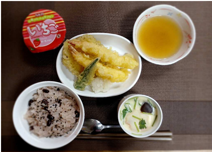
9/16(月)昼食『赤飯・茶碗蒸し・天ぷら盛り合わせ・いちごババロア』