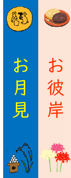
9/24(火)手作りおやつ『2色おはぎ』