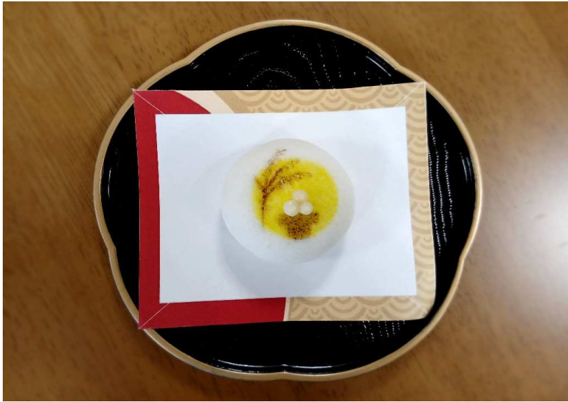
9/17(火)おやつ『お月見饅頭』