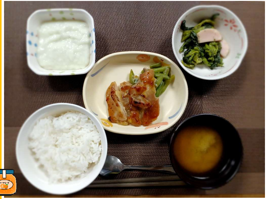
5/14(木)昼食『米飯・味噌汁・鶏肉のマーマレード焼き・菜の花のソテー・メロンムース』