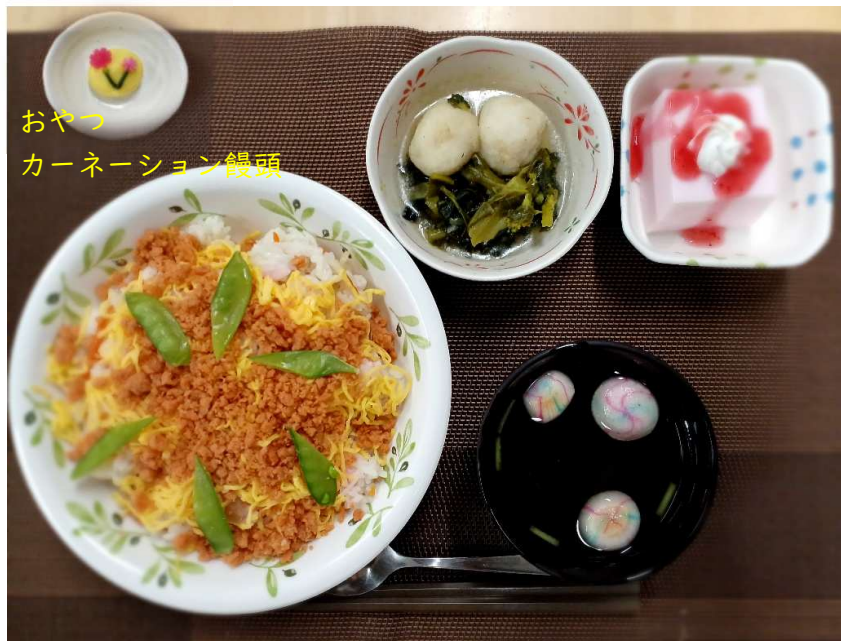
おやつ カーネーション饅頭